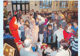
Nikolaus- u. Weihnachtsfest

1969 wurde eine Zweigstelle von Matica hrvatska Zagreb in Karlsruhe gegründet. 1971 wurde der Namen geändert „Društvo članova Matice hrvatske – Dr. Ante Starčević – Karlsruhe“. Seit 17.04.1991 ist der Kroatischer Kulturverein Matica hrvatska e.V. Karlsruhe ein eingetragener Verein.