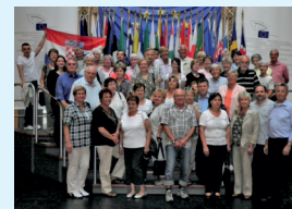
2011 Erste kroatische Flagge im EU Parlament-Straßburg