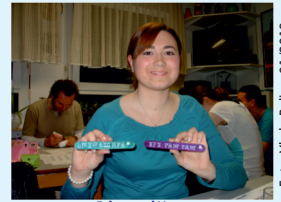
Glagoljica, altkroatischer Schrift

Es kann jeder Vereinsmitglied werden, der die Satzung akzeptiert und zur Verwirklichung der Ziele des Vereins beitragen möchte. Minderjährige Personen bedürfen der Zustimmung der Eltern, um Vereinsmitglieder zu werden.