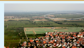
Blick auf den „Kroatienpfad“ von Hambacher Schloss