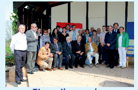
Einweihung der Kroatischen Bank in Dobel